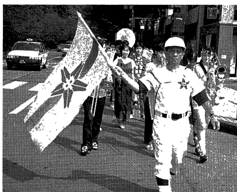
(1997年の一泉行列、一中OBが4名参加)

今年、泉丘高校創立50周年の節目の年となる。学校側と相談のうえ、一泉同窓会も在校生とともに創立記念祭を祝おうということにした。